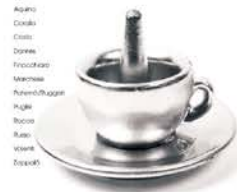
COFFEE BREAK a cura di Nino Costa

2001 In collaborazione con il Dipartimento della Funzione Pubblica organizza la campagna di comunicazione del FORMEZ per il PROGRAMMA RAP 100 SICILIA con la produzione di una rivista e di new letters in qualità di coordinatore di redazione e progettista grafico